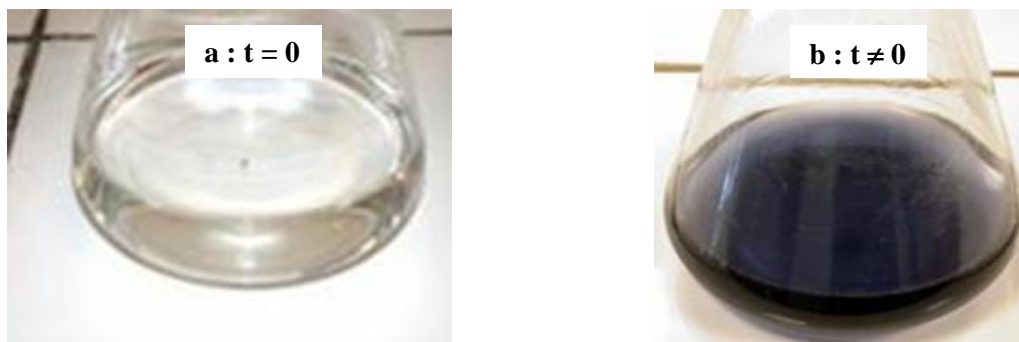
Figure 4 : Coloration du mélange réactionnel (A et B) + (C et D) a : à t = 0 et b : à l'instant t \neq 0

On introduit les quantités ci-après (voir Tableau 1 ) des solutions A et B dans un premier erlenmeyer, et C et D dans un second avec quelques gouttes d'amidon. On mélange les deux solutions à t = 0 (voir Figure 4-a ). Un changement de couleur est observé au bout d'un temps t indiqué dans le tableau 1 et représenté sur la Figure 4-b .