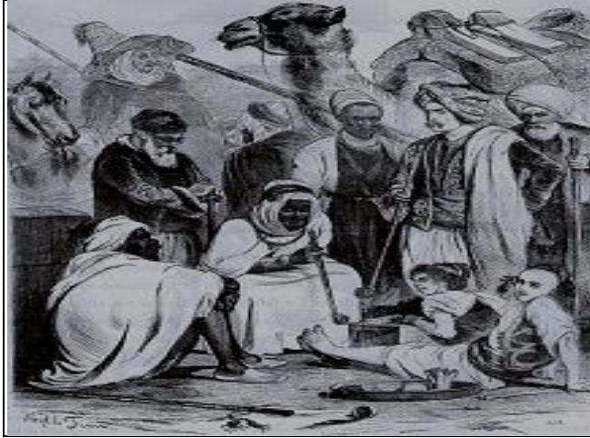
Les tenues vestimentaires des habitants d'Alger (les hommes) vers la fin de l'époque ottomane 3