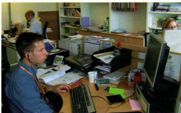
Avec la perspective actionnelle, il ne s'agit plus seulement de communiquer ponctuellement avec des étrangers, mais de travailler en continu avec eux, comme dans une entreprise.

couleur) qui correspondent respectivement à l'AC et à la PA, mais il faut cependant garder à l'esprit la longue durée historique dans laquelle elles se situent. Non par plaisir d'érudition, mais parce qu'actuellement, en FLE et en didactique scolaire des langues étrangères – du moins en France –, ce sont les quatre dernières configurations qui coexistent plus ou moins harmonieusement dans les propositions didactiques, les manuels et les pratiques d'enseignement. C'est ainsi que les épreuves actuelles de langue au baccalauréat français relèvent encore de la configuration n° 2, alors même que les toutes dernières instructions officielles y préconisent la mise en œuvre de la configuration n° 5... (Pour un commentaire plus détaillé d'une première version de ce modèle d'évolution historique, je renvoie les lecteurs à Puren Christian, 2002.)