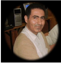
Conçue et réalisée par L'hadi BOUZIDI Octobre 2013