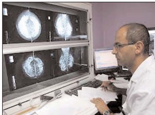
L'association d'aide aux cancéreux, El Fedjr, a estimé que cette situation n'a que trop duré. Son association se démène pour aider les malades et prendre en charge