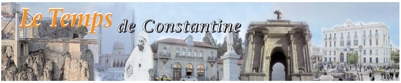
Page animée par Ilhem Tir