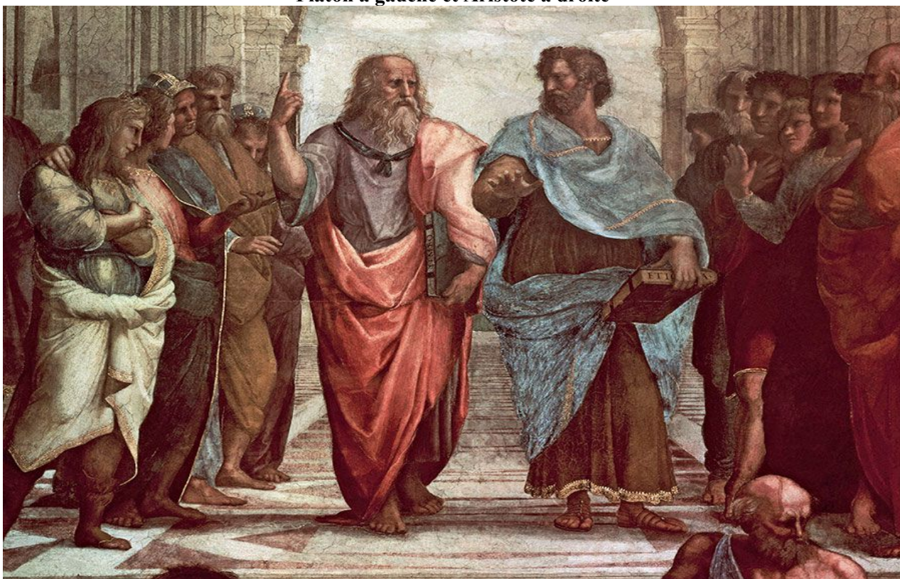
Platon à gauche et Aristote à droite

Platon [427 av. J.-C. à 347 av. J.-C.] et Aristote [384 av. J.-C. à 322 av. J.-C.] vont avoir un point de vue différent sur ces questions :