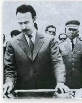
24 اوت سنة 1972. قام هواري...