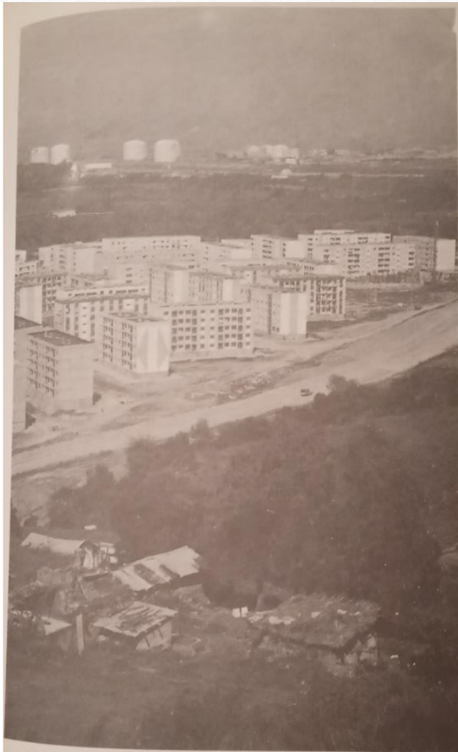
Urbanisation et industrialisation dans l'Algérie moderne : grand ensemble, zone pétrochimique, et bidonville, à Skikda.