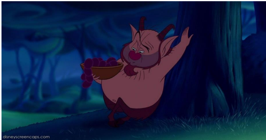
Philoctète, dans « Hercules » de Walt Disney

-La satyre= » créature hybride issue de la mythologie grecque, mi-homme, mi-bouc, ayant des cornes sur la tête ainsi que des oreilles pointues. Ex : Philoctète dans le dessin animé « Hercules ».