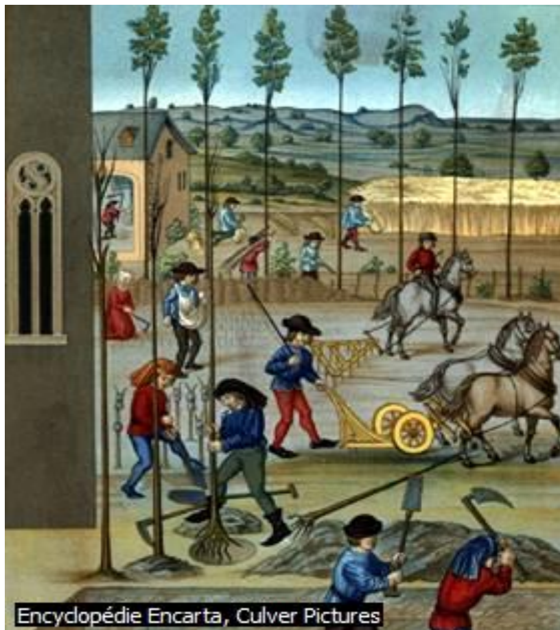
Représentation de serfs au Moyen-Âge

Ils doivent payer des taxes lors de l’utilisation du moulin pour faire le pain.